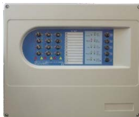
VSN LT Central convencional, modelo de 2-4-8-12 zonas.